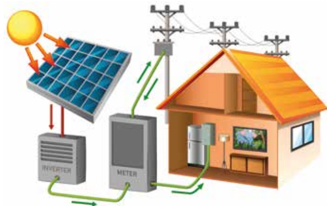
Schéma d'une maison avec une installation : panneau, onduleur, courant continu, courant alternatif. La composition d'un panneau (silicium en couche ...) comme par exemple :

Les panneaux photovoltaïques vont créer un courant continu. Mais les appareils électriques et les éclairages fonctionnent avec un courant alternatif. Le courant continu produit par les panneaux doit être transformé en courant alternatif, c'est le rôle de l'onduleur.